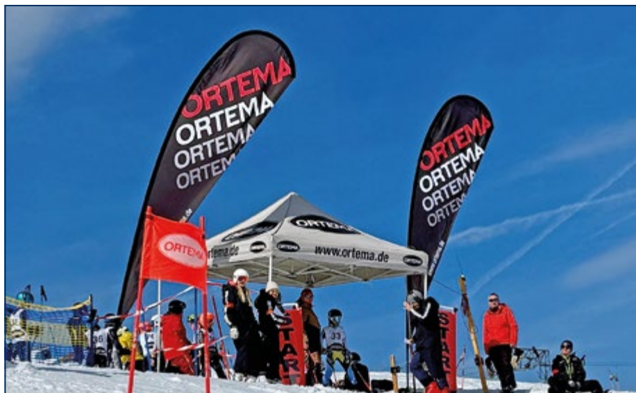
Start, ORTEMA CUP Rennen 1 Diedamskopf

Der ORTEMA Cup der Region Nord des Schwäbischen Skiverbandes feiert 2025 sein fünfjähriges Jubiläum und ist eine großartige Institution geworden, wenn es darum geht talentierten Kindern den Skirennsport näher zu bringen und sie dementsprechend zu fördern.