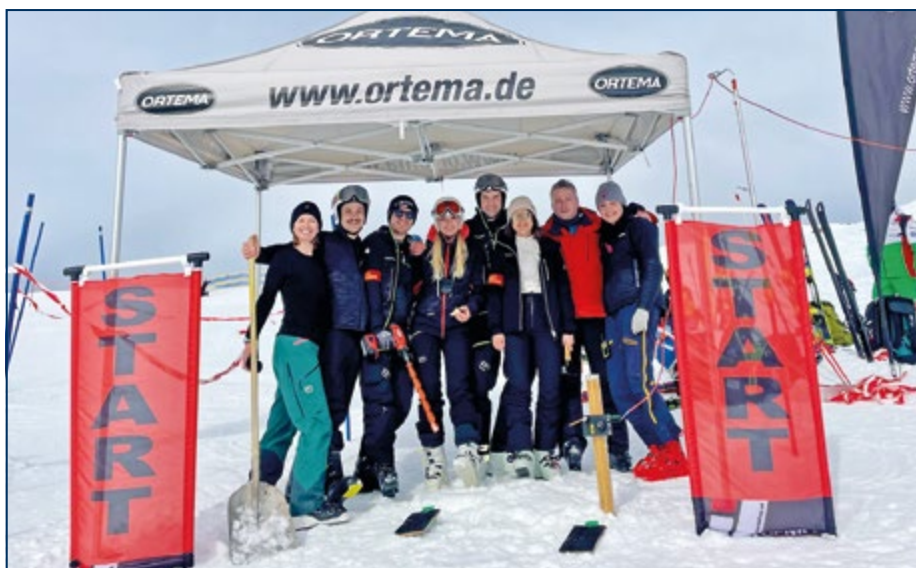
Team Start, ORTEMA CUP Diedamskopf